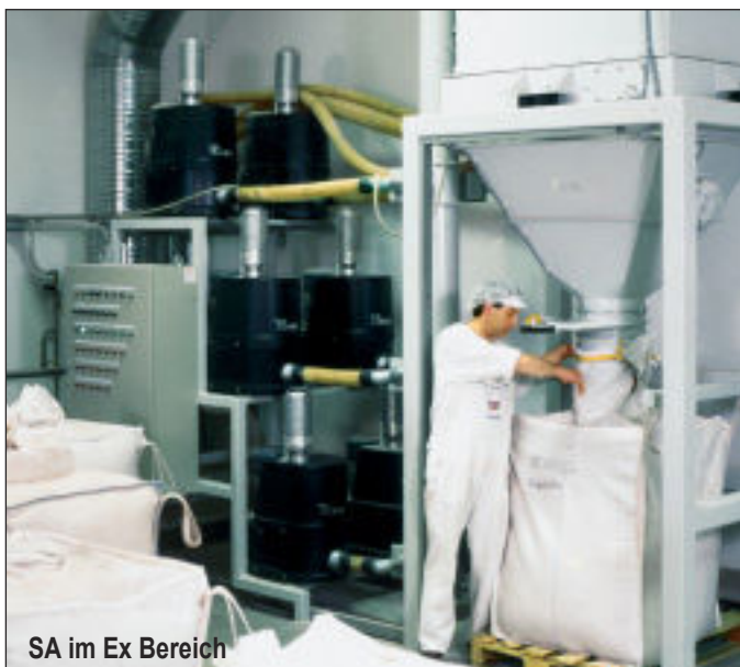
SA im Ex Bereich