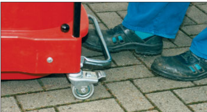
Niezwykle prosta obsługa dzięki opróżnianiu za pomocą pedału