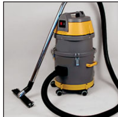
WS 200 z akcesoriami