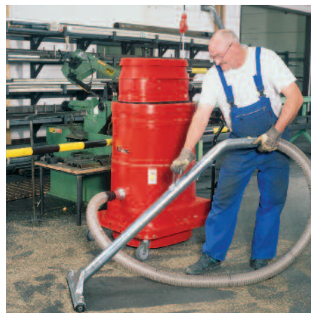
WS 3310 w przetwórstwie metali