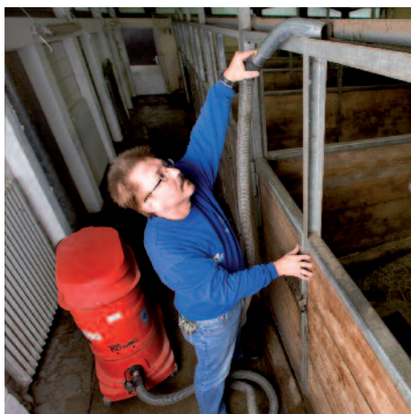
WS 2210 w rolnictwie