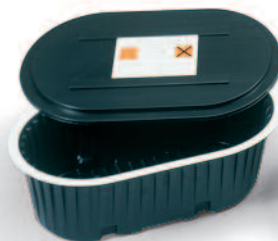
Wanna do usuwania pyłu, z pokrywą