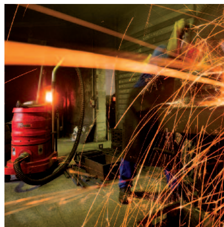
WS 2220 w przetwórstwie metali