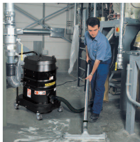
WS 2320 z ochroną przed wybuchem pyłu w przemysle farmaceutycznym