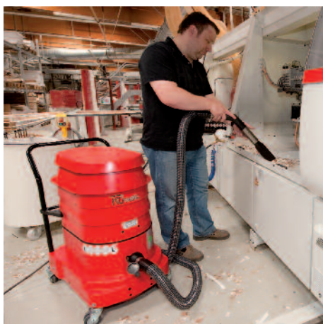
WS 2320 w przetwórstwie tworzyw sztucznych