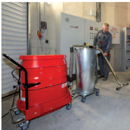
WS 2210 ze wstępnym oddzielaczem w elektrociepłowni