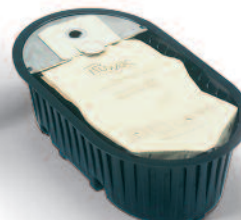
Worek na pył