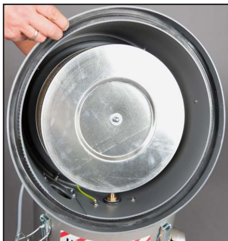
Filtr pyłkowy, klasa pyłu H