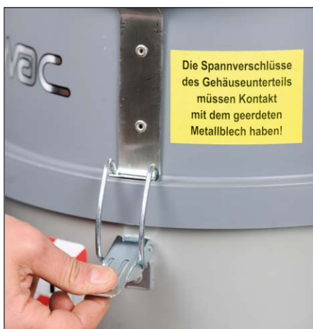
Bezpieczeństwo dzięki zamkom mocującym