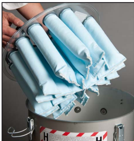
Filtr główny (kanałowy)

Mały odkurzacz przemysłowy, dopuszczony do usuwania drobnych i szkodliwych pyłów. Posiada dopuszczenie do usuwania pyłu klasy H oraz pyłu drzewnego H2. Spełnia najwyższe wymagania, jakie są aktualnie stawiane odkurzaczom przeznaczonym do pracy w przemyśle i budownictwie. Urządzenia można używać do usuwania wszelkich drobnych lub szkodliwych dla zdrowia, rakotwórczych pyłów, np. cementowego lub ściernego.