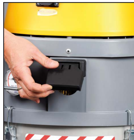
Oczyszczanie typu Air-Shock