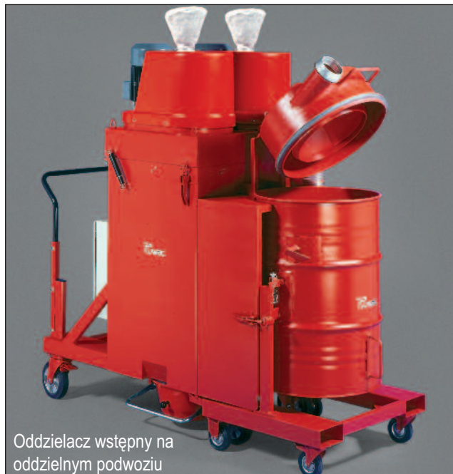
Oddzielną wstępny na oddzielnym podwoziu