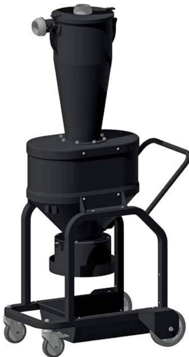
Cyklon z wyjściem na rękaw Longopac®